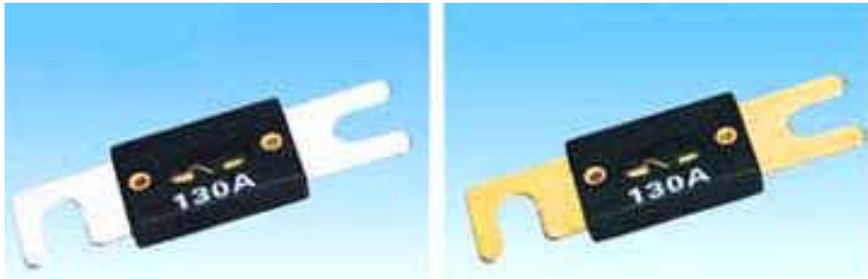
实物与规格尺寸图